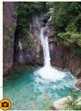
うしがたき牛ヶ滝 巨大な花崗岩が壮麗な景勝地。牛ヶ滝展望台への遊歩道はお勧めのコースです。