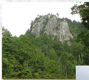
ふどう不動岩展望台

不動岩上の展望台からは、高峰山・恵那山・笠置山、よく晴れた日には、遠く名古屋市も眺望できます。