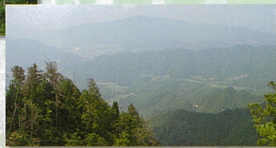
展望台からの眺め

不動岩上の展望台からは、高峰山・恵那山・笠置山、よく晴れた日には、遠く名古屋市も眺望できます。